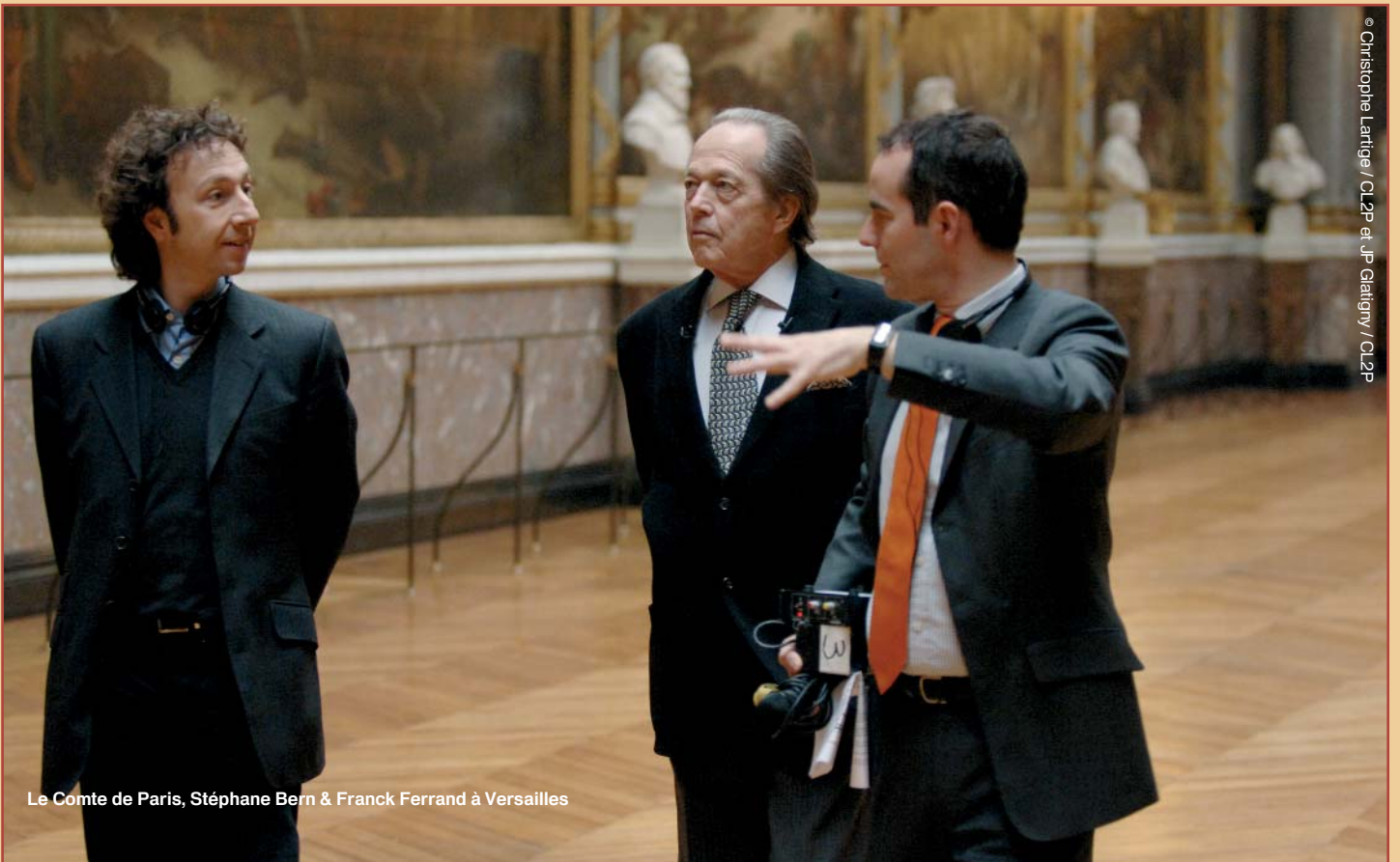
Le Comte de Paris, Stéphane Bern &amp; Franck Ferrand à Versailles

Le samedi soir, avec Personnel et confidentiel , France 3 propose une collection de documentaires doublement personnalisés : tous privilégient en effet le regard particulier d'un auteur sur une figure de référence.